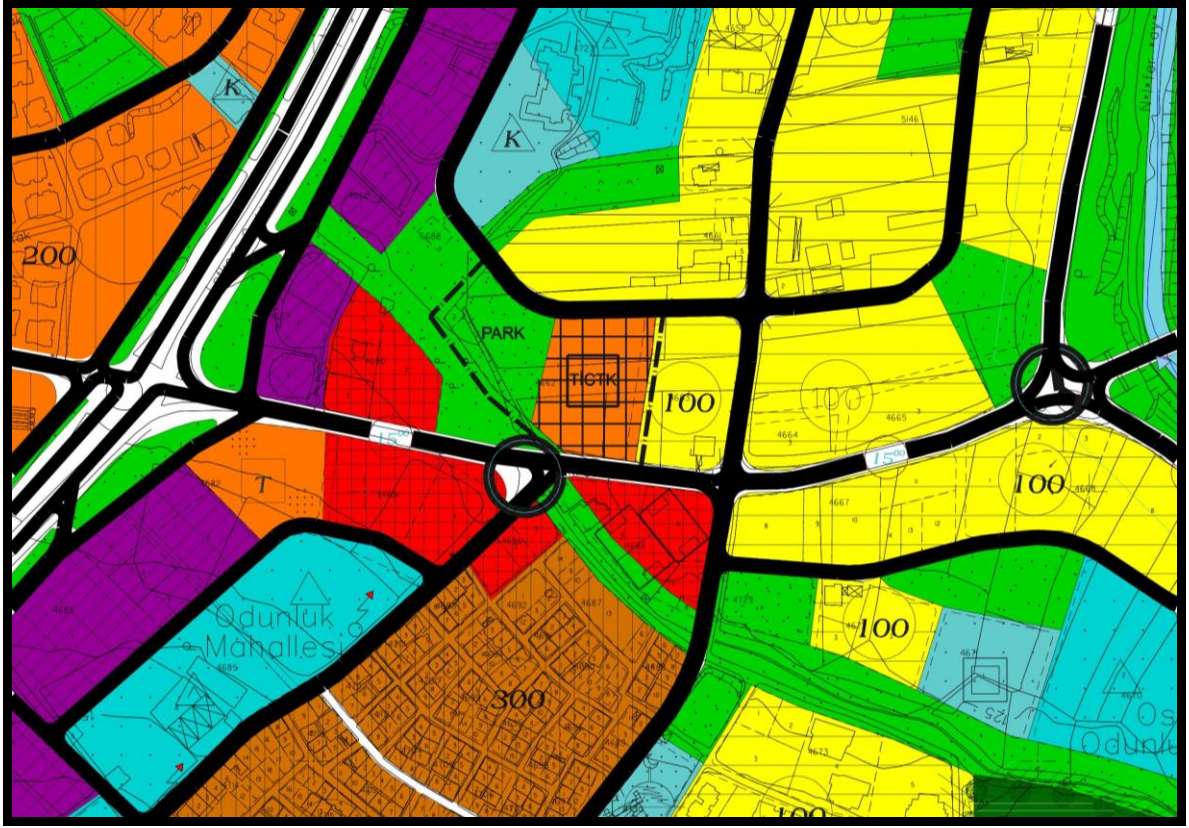
Önerilen 1/5000 Ölçekli Nilüfer Belediyesi Nazım İmar Planı Değişikliği Örneği

Plan değişikliğine konu alan; 1/25000 Ölçekli Nazım İmar Planı Revizyonunda; “Orta Yoğunluklu Konut Gelişme Alanı” , 1/5000 Ölçekli Nilüfer Nazım İmar Planı’nda ise “Sağlık Tesisleri Alanı” olarak planlıdır. Söz konusu taşınmaz yakın çevresinde yeterli donatı alanları ve Sağlık Tesisleri yer almaktadır. Özel mülkiyette tesis edilecek bir sağlık tesisi ihtiyacı olmadığından parsel maliki parseline “Ticaret, Turizm, Konut Alanı” olarak kullanmayı talep etmektedir. 1/25000 Ölçekli NİP Revizyonunda da “Konut Gelişme Alanı” olarak planlı olan parsel alanında ticaret, turizm, konut alanı taleplerinin bu bölgede yoğunluk kazanmasından dolayı, parselin 1/5000 Ölçekli Nazım İmar planında da “Ticaret, Turizm, Konut Alanı” olarak planlanması gerekliliği doğmuştur. Konut kullanımının gerektirdiği donatı alanı ise parselin batı kısmının “Park Alanı” olarak planlanması ile sağlanmıştır.