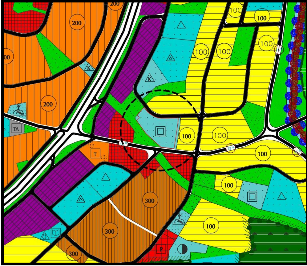
Yürürlükteki 1/5000 Ölçekli Nilüfer Nazım İmar Planı Örneği