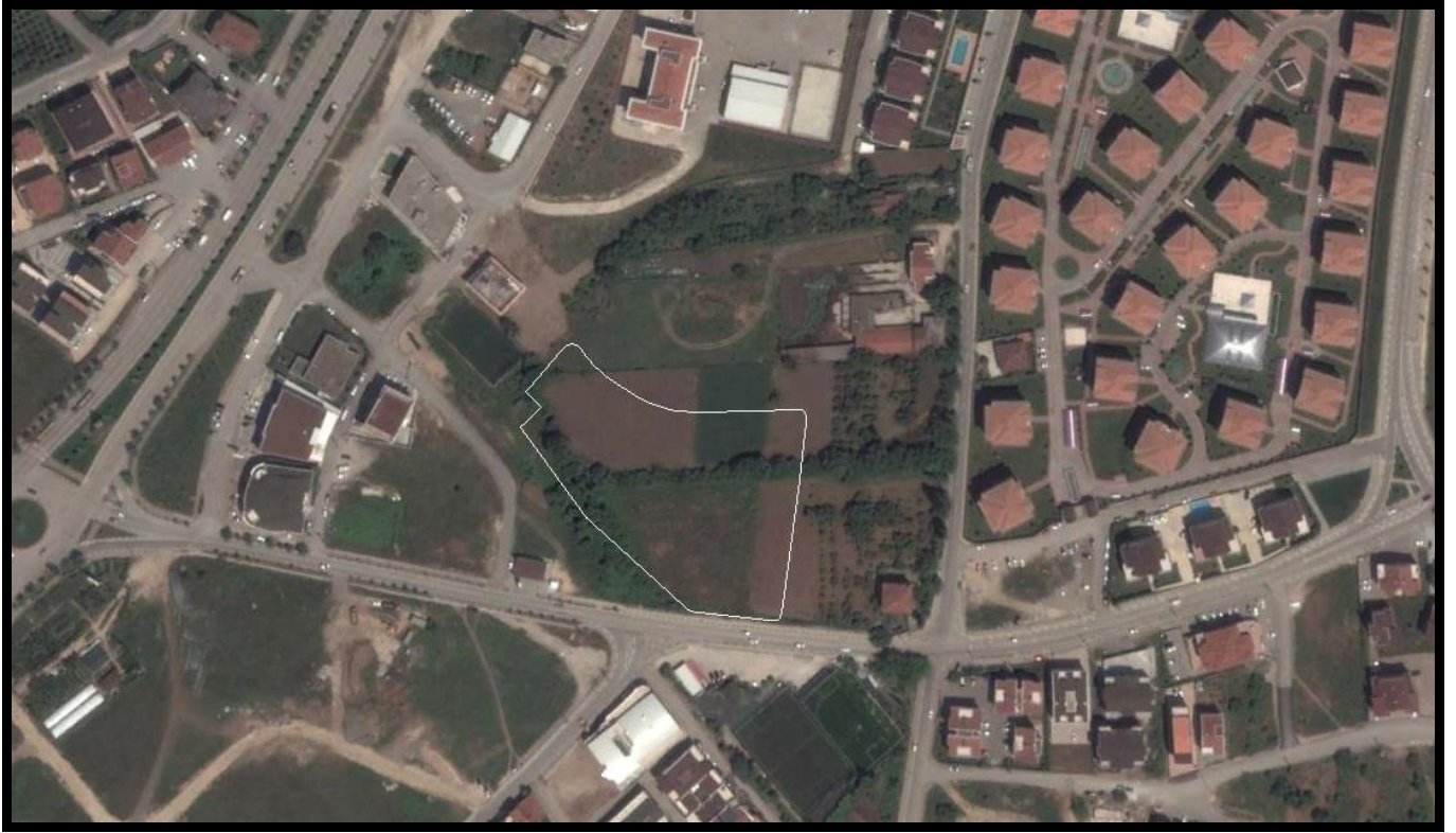
Planlama Alanı ve Yakın Çevresi Uydu Görünümü